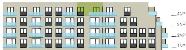
Východní pohled na dům / Building View - east side