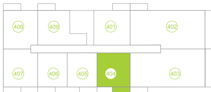
Půdorys podlaží / Floor plan